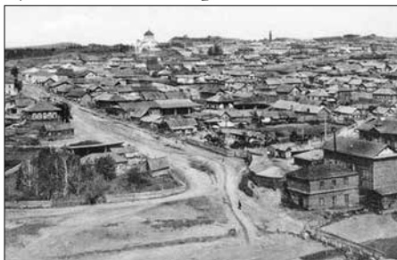
Город Новониколаевск, 1930 г.