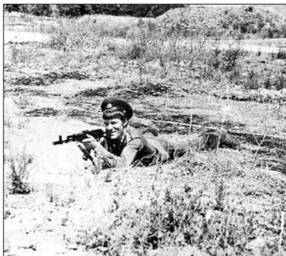
Во время учений на погранзаставе

– Перешли границу и как будто попали в средние века. Нищета страшная, грязные оборванные крестьяне в деревянных башмаках пахнут клочок земли деревянной сохой на быках. Но молитвы слушают по японским магнитофонам, каких мы и в глаза не видели. Днём местный житель выглядит несчастным, низко кланяется, улыбается, стук его деревянной обуви слышен за 200 метров. Но наступает ночь, и он достаёт заранее спрятанную винтовку, идёт убивать наших ребят, становясь невидимым и неслышимым. А у нас приказ – мирное население не трогать. Если знали, что на