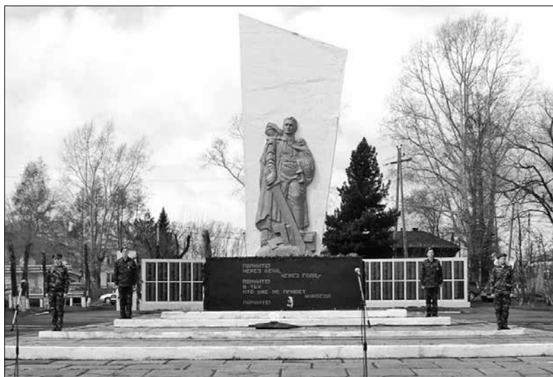
Памятник в Тязинском районе Кемеровской области